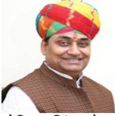
गोविन्द सिंह डोटासरा शिक्षामंत्री राजस्थान सरकार, जयपुर