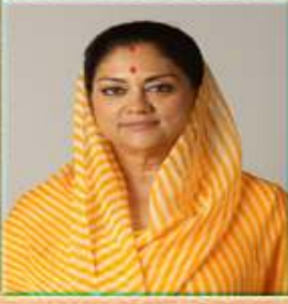
Smt. Vasundhra Raje Hon'ble Chief Minister, Rajasthan

Welcome to Sarva Shiksha Abhiyan Rajasthan