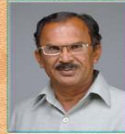
Prof. Vasudev Devnani Hon'ble Education Minister, Rajasthan

Welcome to Sarva Shiksha Abhiyan Rajasthan