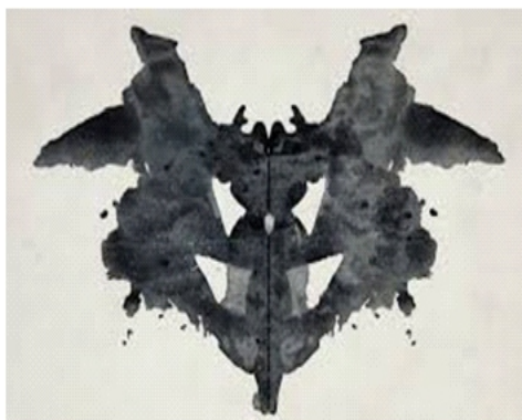
चित्र 2.1 रोशा स्याही धब्बा परीक्षण में प्रयुक्त एक कार्ड

यह परीक्षण हर्मन रोशा द्वारा विकसित किया गया। इसमें दस स्याही धब्बे जैसे चित्र वाले 10 कार्ड होते हैं। (देखें चित्र 2.1) प्रत्येक स्याही धब्बा 7 x 10 के आकार के कार्ड के ठीक बीच में मुद्रित होता है। प्रयोज्य इन स्याही धब्बों को देखकर यह बताता है कि वह इस कार्ड में क्या देखता है। प्रयोज्य की इन अनुक्रियाओं की व्याख्या/अंकन के लिये एक विस्तृत पद्धति भी तैयार की गई है। इस परीक्षण के उपयोग एवं परिणामों की व्याख्या के लिये कुशल प्रशिक्षण की आवश्यकता होती है।